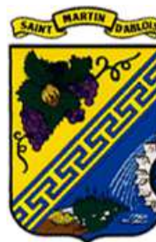
SAINT MARTIN D'ABLOIS