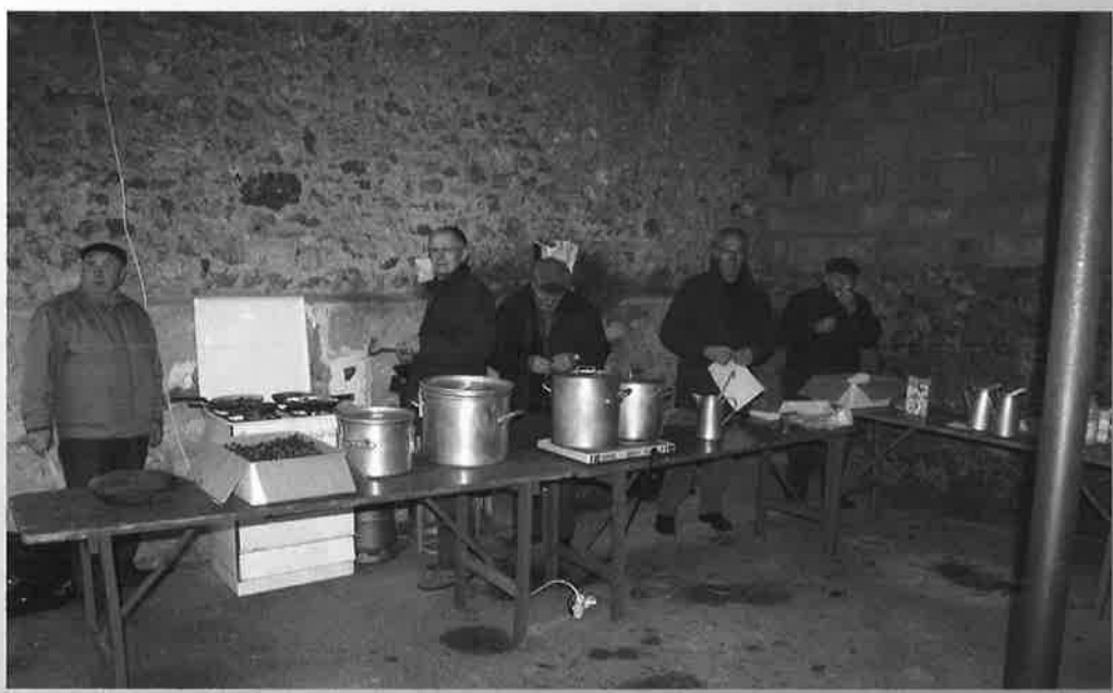
Après le concert de Noël , vin chaud et châtaignes préparés par le Club Loisirs et Amitiés (Organisation Commission Municipale Culture et Spectacles ).