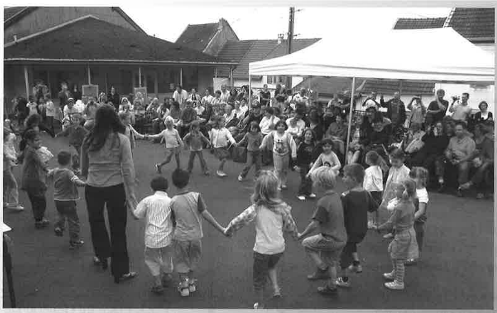
Kermesse de l'école Maternelle