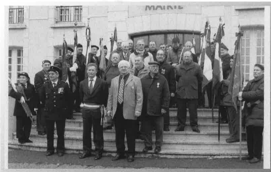
5 décembre : Les anciens combattants après la Célébration en mémoire des soldats tués lors des conflits en Afrique du Nord et l'inauguration de la réfection du Monument aux Morts.