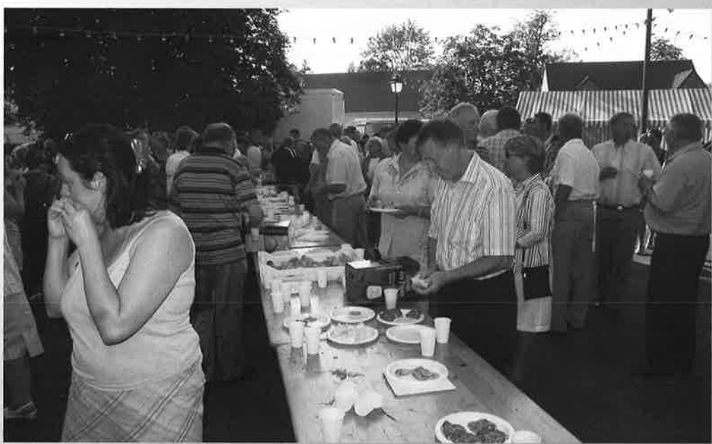
La Rondelle du 14 juillet (Commission Municipale des Fêtes).