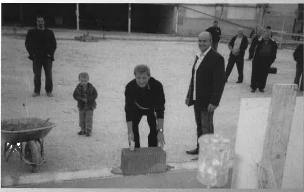
Pose de la Première Pierre de la Halle des Sports.