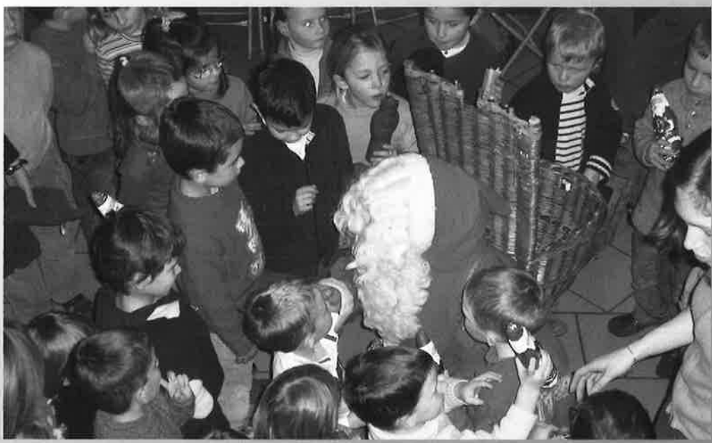
L'Arbre de Noël de l'Association des Parents d'Elèves.