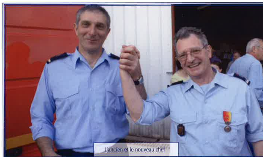
L'ancien et le nouveau chef