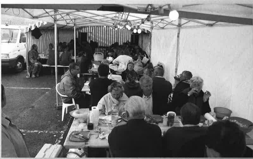
La Tablette , repas de quartier (organisation : Saint Martin Jumelage )