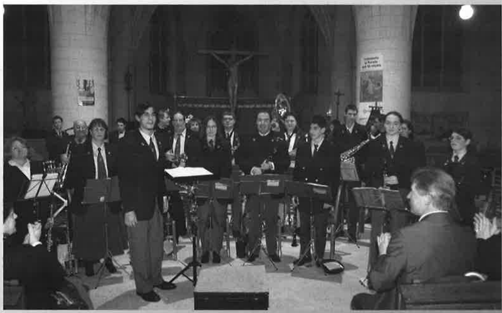
Concert de Noël par l'Avenir Musique , organisé par la Commission Municipale Culture et Spectacles (Chemin des Crèches ).