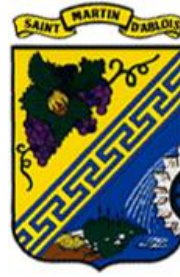
SAINT MARTIN D'ABLOIS